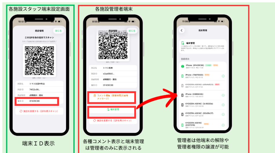
端末 I D 表示

コメントや災害時の回答は施設の管理者しかできません。管理権限を明確にするため、各端末に端末情報をつけるとともに管理者端末からその権限の譲渡や削除ができるように端末管理機能をつけました。